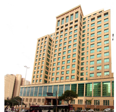
Solicitação de informações à Sefaz sobre os recursos arrecadados para o FECOEP