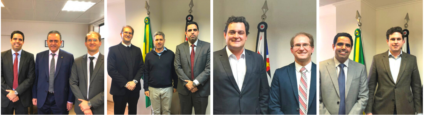
Deputados Federais são recebidos na sede do Parquet de Contas