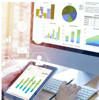
Pedido de multa a municípios que sonegam informações contábeis