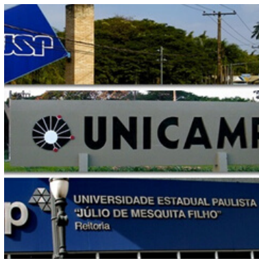
Representações contra aumento de salários em Universidades