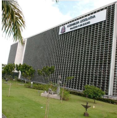
Solicitação de informações à Alesp sobre "rachadinha"