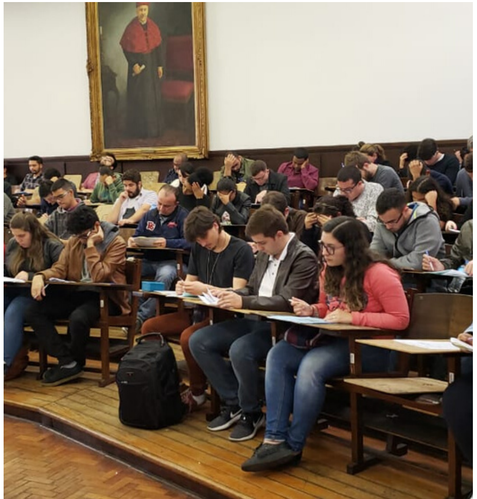
V Processo Seletivo de Estagiários