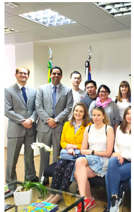
Estudantes da Universidade de Łódz