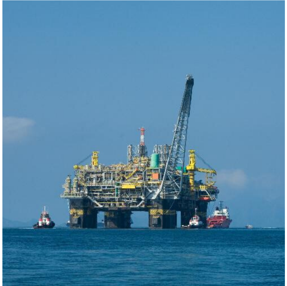
Pedido de alerta sobre o uso de recursos arrecadados com os leilões do pré-sal