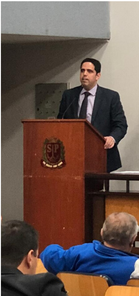
Procurador-Geral fala sobre condutas vedadas a agentes públicos em ano eleitoral