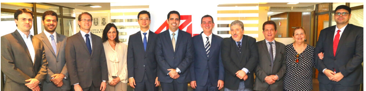
Vista de cortesia à Associação Paulista do Ministério Público