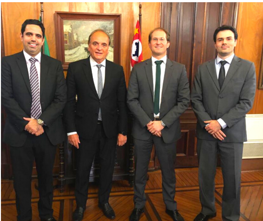
Encontro com o Secretário de Justiça de SP Paulo Dimas Mascaretti