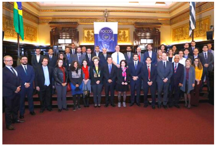
MPC-SP assume Secretaria Executiva do FoccoSP em 2020