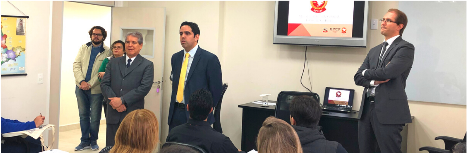
Curso de Formação de Novos Servidores do MP de Contas